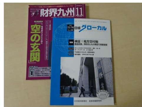
教員コメント掲載雑誌