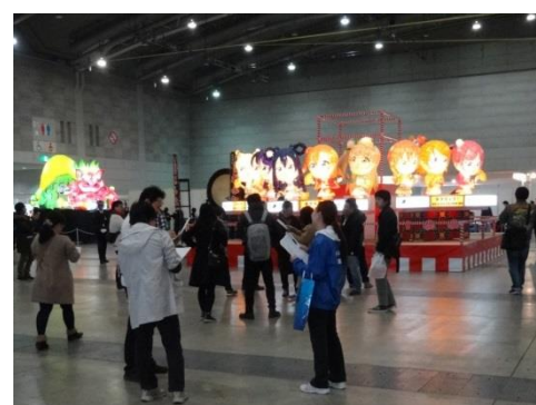
北九州ポップカルチャーフェスティバル 2016 来場者調査 （西日本総合展示場新館、あさの汐風公園）[南]