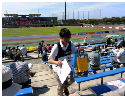
Jリーグ公式スタジアム観戦者調査 （北九州市立本城陸上競技場）[南]